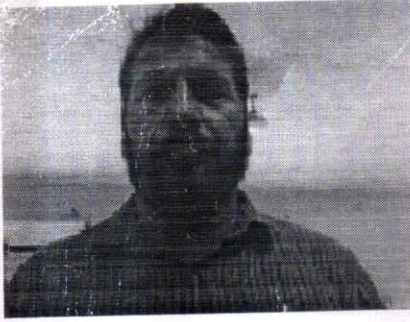
पट्टा देने वाला